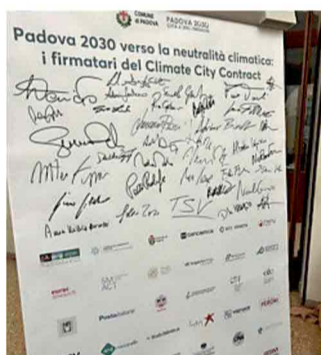
Il contratto per il clima firmato

Arpav, Camera di Commercio e Provincia per gli enti pubblici. Banca Etica, Bcc Veneta e Cherry Bank per gli operatori finanziari. Eurac, Smact e Università per gli enti di ricerca e di formazione. AcegasApsAmga, Busitalia, Interporto, Padova Hall e Poste Italiane per i servizi al territorio. Acli, Associazione biologi del Veneto, Centro servizi volontariato, Fondazione Oic e Fondazione Teatro stabile del Veneto per i servizi a finalità sociale e di informazione alla cittadinanza. Ard Raccanello (edilizia),