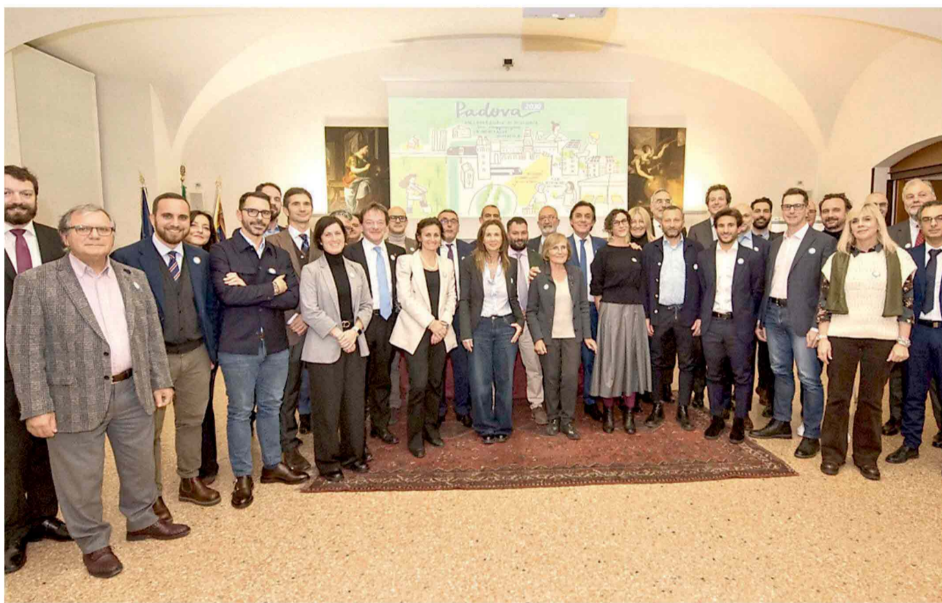
I sottoscrittori del contratto per il clima, tutti insieme in sala Paladin dopo la firma e l'impegno pubblico assunto con il Comune