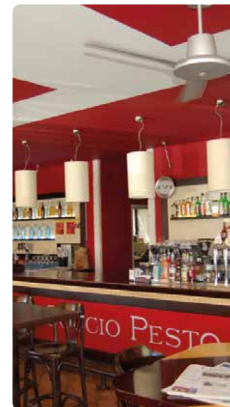
bar e ristorazione bar & restaurants