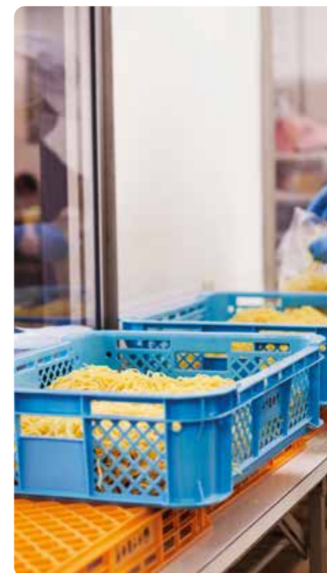
industria alimentare food industry