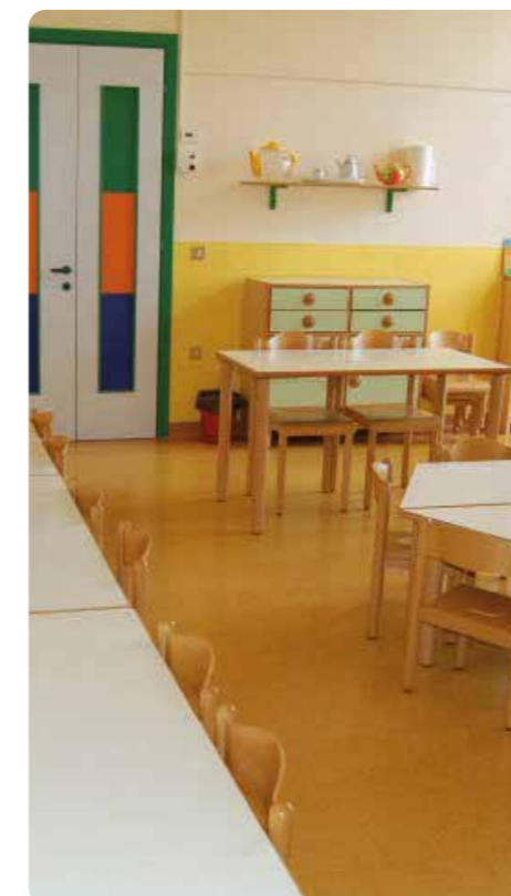
ambienti pubblici public premises