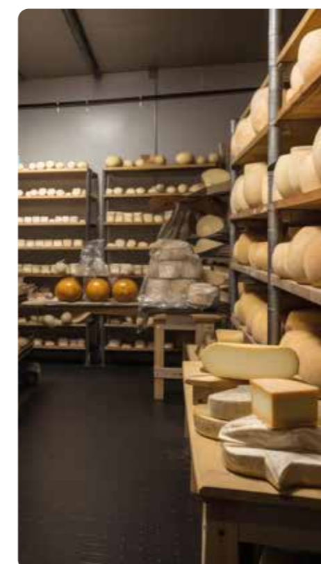
reparti di stagionatura maturing & ripening chambers