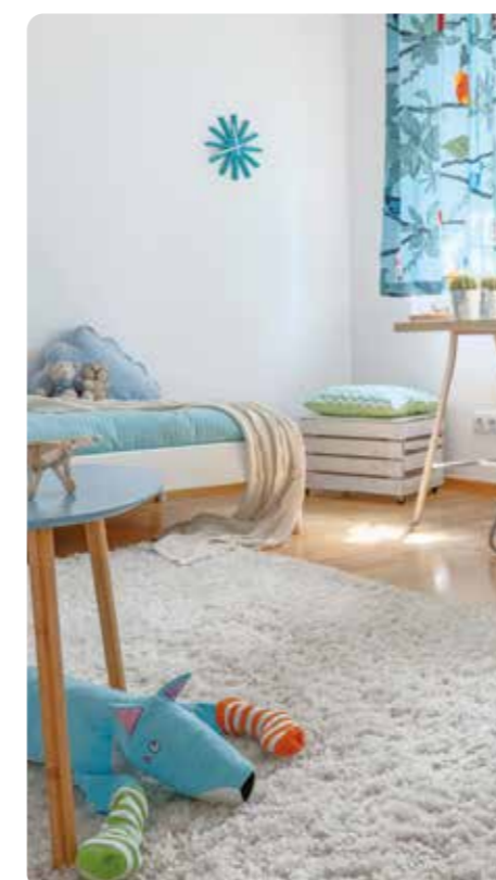
ambienti domestici traditional home interior